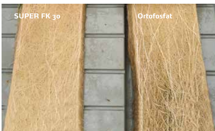
Bedre utviklet rotsystem