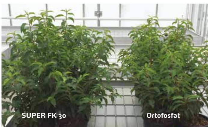
Bedre tilvekst- bedre økonomi