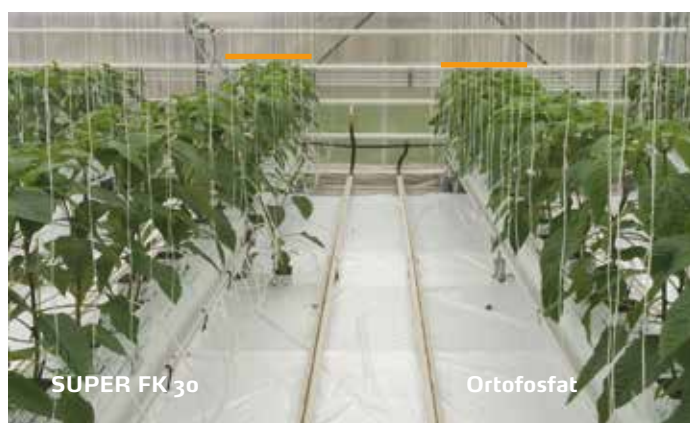
Kraftigere vekster som vokser raskere